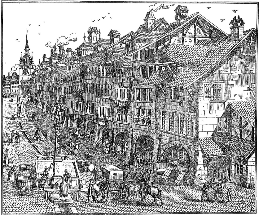
Die Spitalgasse, Schattseite mit dem Davidsbrunnen um die Mitte des 18. Jahrhunderts.

„Wir haben mit Fleiß dies Haus gebaut, Dabei auf Gottes Güte und Segen getraut. Wir machten es stark aus Holz und Stein Und bauten drei fromme Wünsche hinein: Der erste heißt: Langes Leben darin; Der zweite: Gesundheit und fröhlicher Sinn, Der dritte heißt: Lebt treu und recht, Ein Beispiel kommendem Geschlecht. Und zwingt euch der Tod das Leben ab, Und müßt hinunter ihr ins Grab, So mög' man euer treu gedenken Und Gott euch seine Ruhe schenken.“