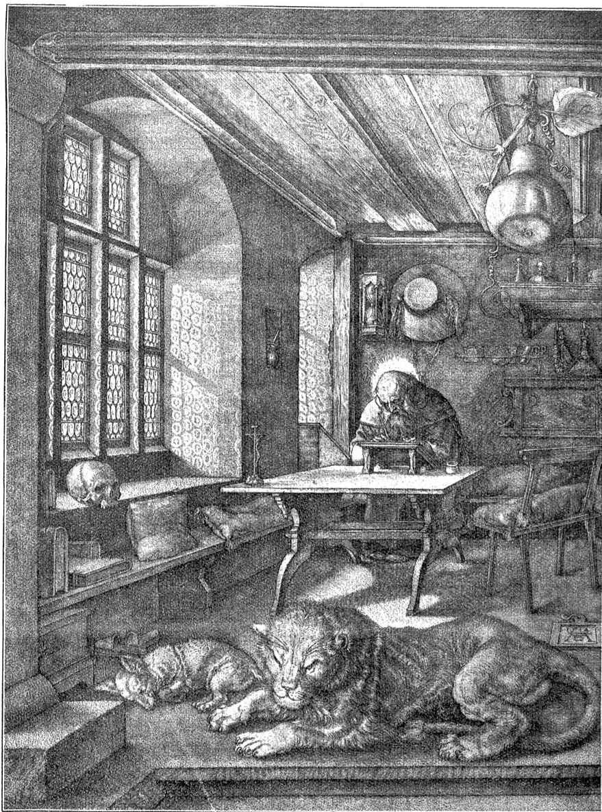
Albrecht Dürer: Hieronymus in der Zelle.

In gar verschiedenen Gangarten war man den Rain hinaufgepilgert. Die einen gingen auf der Terrasse hin und her, vom Gartenhaus bis zur Kornelkirschenlaube. Andere, Klärchen und die zwei Pfarrhausjüngsten, holten sich Rosen, Bernhard stieg hinauf zu den Arbeitern, um ihnen einen guten Abend zu wünschen, und die Alten saßen auf den grünen Bänken vor dem Haus und freuten sich an Gottes Meisterwerk, den silbernen Bergen. Susanna ließ