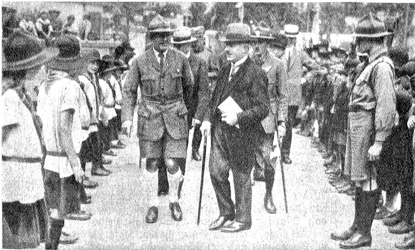
Bundesrat Motta bei den Pfadfinderinnen.