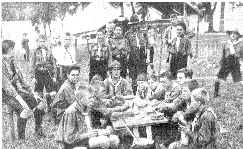
Erstes schweiz. Pfadfinderlager in Bern. Lager-Tagll.

So gegen 3 Uhr ging's dann los, durch die Gerechtigkeitsgasse u. bis zum Bundesplatz. Es war etwas bunt, das ist ja richtig. Sehr viel Drüll lag nicht im Zuge, wer Pfeifer oder Trommler hatte, stellte sie an die Spitze,