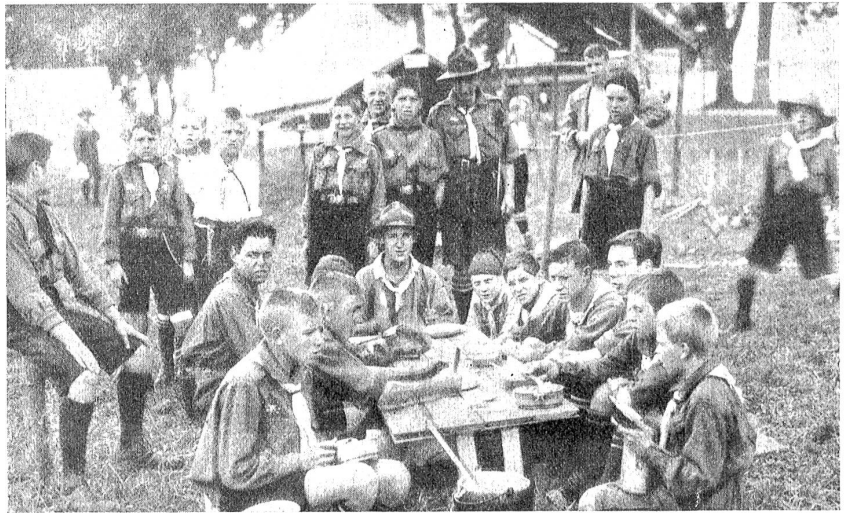
Erstes schweiz. Pfadfinderlager in Bern. Lager-Idyll.

So gegen 3 Uhr ging's dann los, durch die Gerechtigkeitsgasse u. bis zum Bundesplatz. Es war etwas bunt, das ist ja richtig. Sehr viel Drüll lag nicht im Zuge, wer Pfeifer oder Trommler hatte, stellte sie an die Spitze,