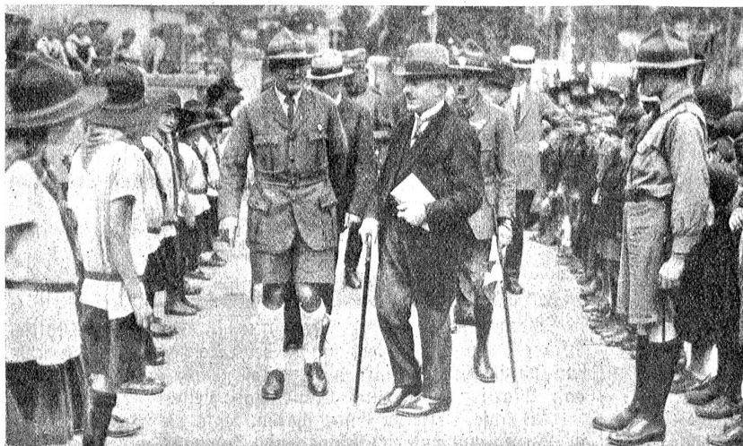
Bundesrat Motta bei den Pfadfinderinnen.