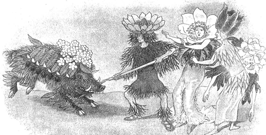
Ernst Kreidolf: Adonis.

Jugend! Sie ist uns Erwachsenen ein ewig neues Problem. All' Tag' und all' Stund' haben wir uns mit ihm zu beschäftigen. Denn sie sind zumeist nicht so, wie wir sie haben möchten, unsere Jungen. Sonst fragt nur die Eltern, die Lehrer, die Lehrmeister. Sie sind zu lärmend, zu ungestüm, zu unbescheiden, zu begehrlisch, zu selbstisch, zu anmaßend — wir könnten ein Duzend solcher eben nicht gerade „verschönernder“ Beiwörter aufzählen. Und doch — wir wissen es ja alle — wir tun ihnen Unrecht: die Jugend