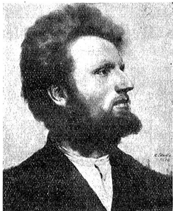
Karl Stauffer. — Kopfstudie.

„Ich freue mich, wenn ich nur seine Stimme höre“, gab Klärchen zu. Darauf ging sie mit Susanna durch die Säle. Es war alles altmodisch, die Betten, die Tische und