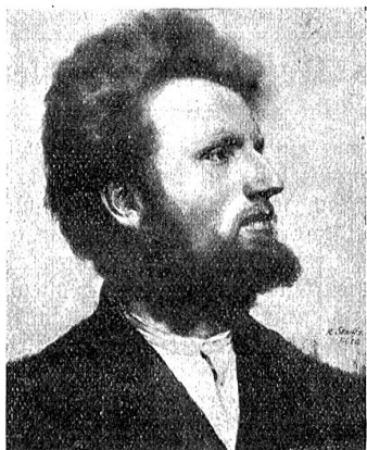
Karl Stauffer. — Kopfstudie.

„Ich freue mich, wenn ich nur seine Stimme höre“, gab Klärchen zu. Darauf ging sie mit Susanna durch die Säle. Es war alles altmodisch, die Betten, die Tische und