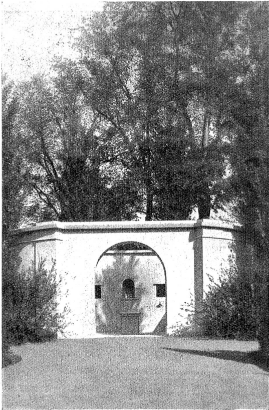
Friedhofsausstellung Bern, Juni—September 1925 (Bremgartenfriedhof). Kolumbarium.

Susanna für sie tun? Womit konnte sie ihr Andenken ehren? Wie es vor dem Vergessen retten? Darüber dachte sie