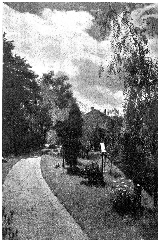
Sriedhofsausstellung Bern, Juni—September 1925 (Bremgartenfriedhof). Ländlicher Sriedhof.

an Klärchen. Da der Nachmittag am Sinken war und es kühl wurde, waren ihre Finger steif und ungeschickt. Aber