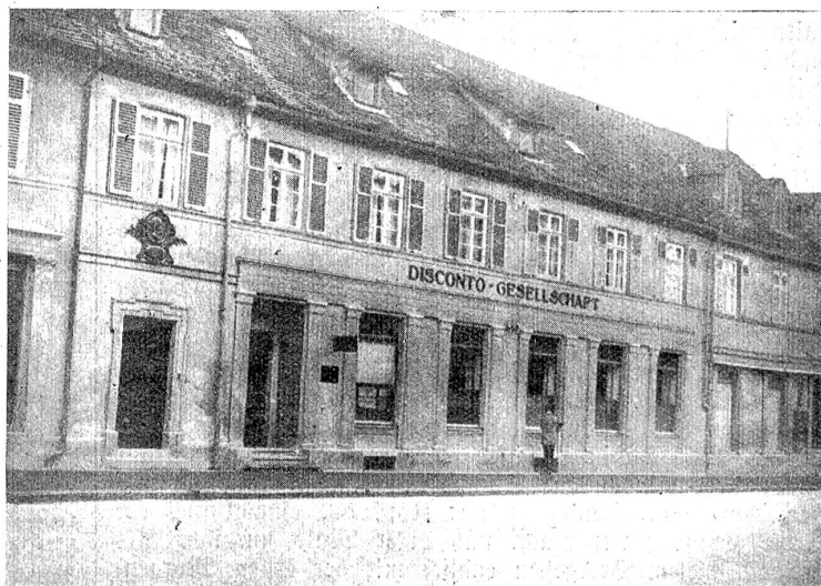
Zum 50. Todestag des Dichters Eduard Mörike. — Mörikes Geburtshaus in Ludwigsburg.