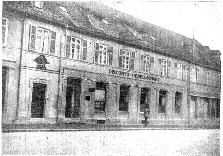
Zum 50. Todestag des Dichters Eduard Mörike. — Mörikes Geburtshaus in Ludwigsburg.