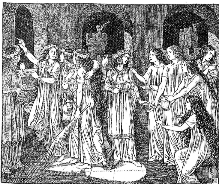
Die klugen und die törichten Jungfrauen.

Wir müssen innerlich ein wenig an uns arbeiten und suchen, milder in unserm Urteil, anspruchsloser in unsern Forderungen zu werden. Wir müssen anfangen, die Leute zu nehmen wie sie sind, und zur Erleichterung der Arbeit immer eingedenk sein, daß es in Nord und Süd, West und Ost immer wieder die alte Geschichte ist, und daß wir selber die Fehler teilen, die wir an andern rügen und verdammen. Theodor Fontana.