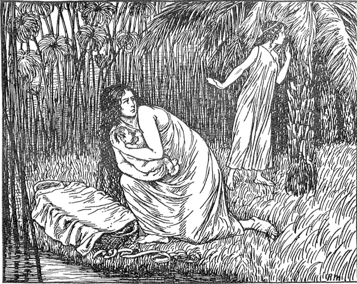
Die Aussetzung des Moses.