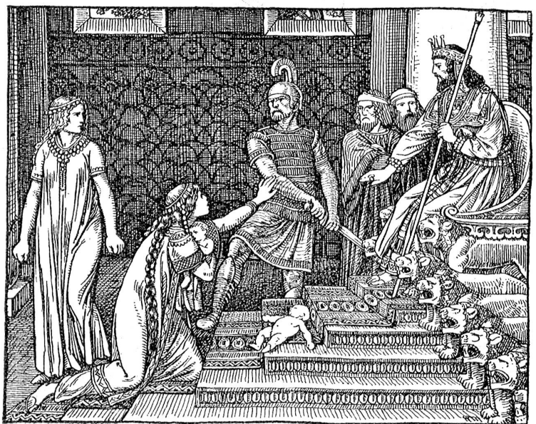
Salomos weises Urteil.