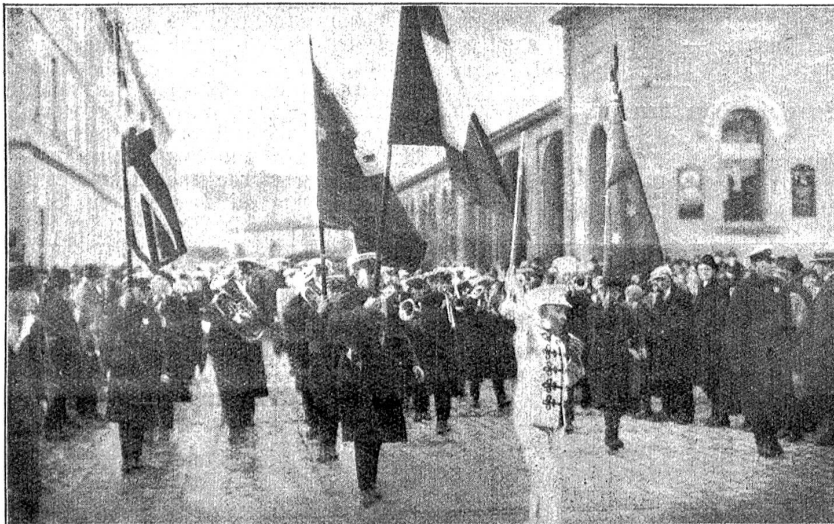
Die australischen Studenten in der Bundesstadt.