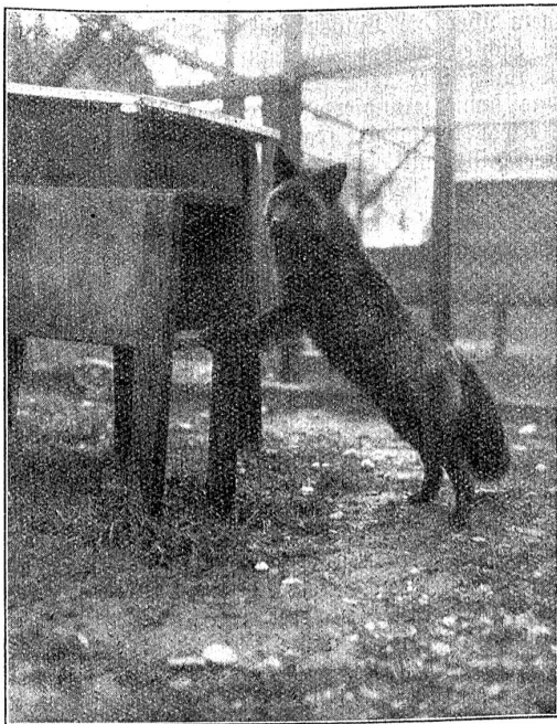
Ein acht Monate alter schöner Fuchs vor dem Eingang in seine Behausung in den Gehegen des Rud. Ingold-Babic, Herzogenbuchsee.

Das einzige Tier, welches bis heute zu seiner Selbst-erhaltung in Domestikation gebracht worden ist, ist der Silberfuchs. Trotzdem die Zivilisation und die Kultur des Menschen mit ihrer Zerstörungswut in die Wälder und Schlupfwinkel der Tiere immer weiter vorgedrungen ist, hat bis kürzlich niemand daran gedacht, die wertvollen Pelzträger, die unabweisbar der Ausrottung anheim gefallen wären, durch Züchtung in Gefangenschaft zu erhalten. Zu jeder Zeit wurden wilde Tiere, also auch Füchse, welche wild gefangen wurden, in einzelnen Individuen für längere oder kürzere Zeit am Leben gehalten, sei es zu Studienzwecken, sei es als Kuriosität oder zum Vergnügen.