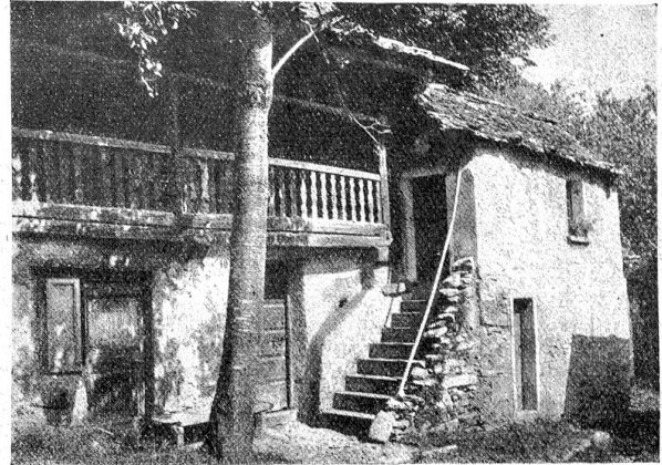
Haus im Bleniotal

des Hauses aus Granit, der aus dem anstehenden Felsen gebrochen ist. Gewisse dieser Steinhäuser könnten als der verkörperte Traum eines genügsamen Weinbauers dieser Gegend bezeichnet werden, so spiegelt sich in ihrer schlich-