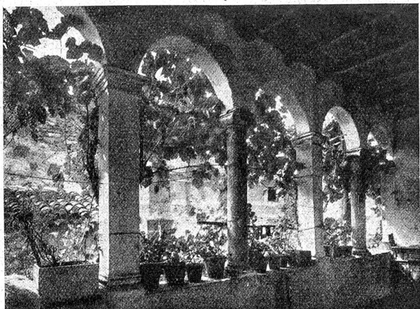
Das Haus Ruggia zu Marcote. Klassischer Laubengang im Grünen von innen gesehen