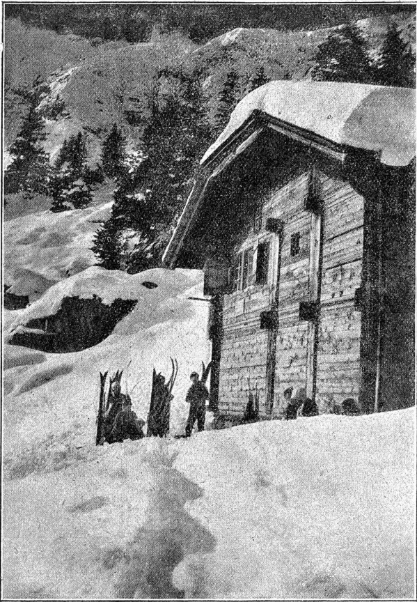
Skihütte im Aeschimental bei Kandersteg.

In den großen Kurorten überwiegt die Freude an Festen, Tanz und Flirt allerdings oft die Freude am Sport. Tadellose Ausrüstung, eleganter Sportsdreh ist für viele.