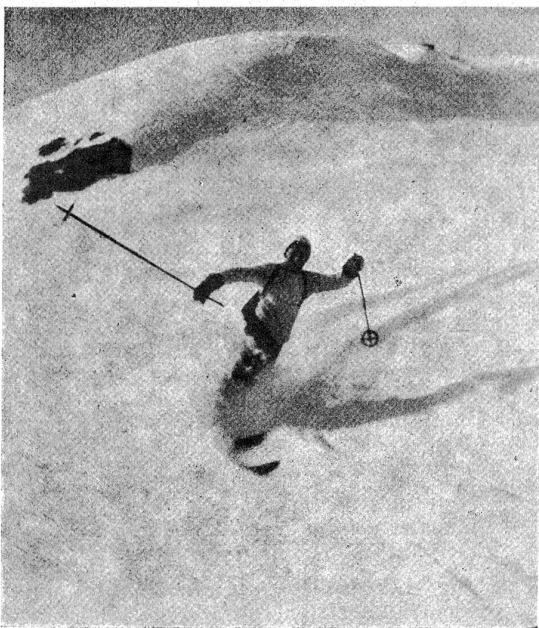
Ein junger Meisterläufer.

Gegen Abend kommen wir im Tal unten an. Mit letzter Kraft übergießt die Sonne die höchsten Bergkämme mit leuchtendem Purpur. Ein rosiger Schimmer liegt über dem