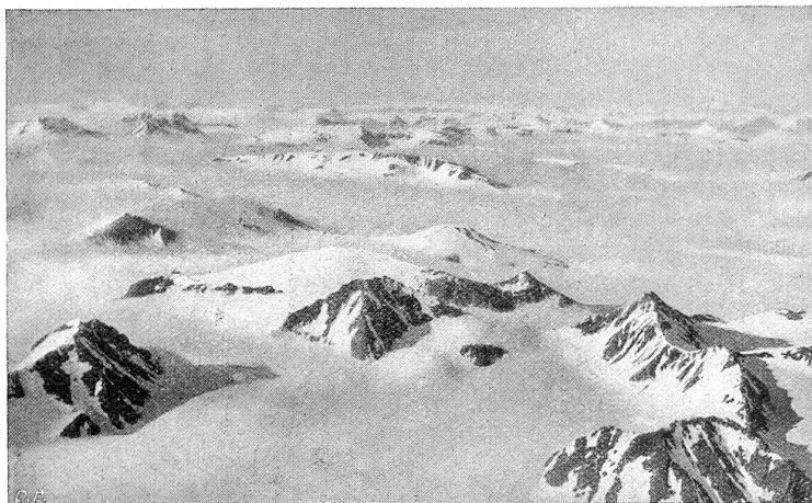
Aus 1200 Meter nach Norden. Firnplateau mit Nunataks. Links hinten: Königinnen, 3 Kronen. Ungefähr in der Mitte hinten: Dladem.

fen Autotypen reproduziert. *) Dazu enthält das Buch einen hochinteressanten Text. Mittelholzer erzählt hier in inhaltreicher, packend schöner Darstellung seine Reise nach Spitzbergen und seine Flieger- und Photographenerlebnisse. Es ist kein gewöhnliches Reise- und Abenteuerbuch, für die leichte Unterhaltung geschrieben. Es ist viel mehr eine Monographie Spitzbergens von hohem wissenschaftlichem Wert. Denn nebst dem von Mittelholzer geschriebenen Text, der schon an sich wertvoll ist durch das reiche in ihm verarbeitete Wissen, enthält das Buch eine ausführliche Einleitung aus der Feder des gelehrten Spitzbergenforschers und Geographen Prof. Dr. Kurt Wegener; sie gibt ein vorzügliches Bild von Spitzbergen als geographische Erscheinung. Dieser Einleitung schließen sich an: ein Aufsatz von Prof. Dr. A. Miethe über „Photographische Bedingungen der Flugzeugaufnahmen“ und ferner: ein Aufsatz von Kapitän S. Bonfor über „Die Bilderausbeute der Junkerschen Spitzbergene Expedition vom geographisch-vermessungstechnischen Standpunkt aus“. Diese beiden letzten Beiträge fassen die photographischen Ergebnisse der Expedition besonders ins Auge, während Mittelholzer selbst seine Fliegererfahrungen in den Mittelpunkt der Schilderungen stellt.