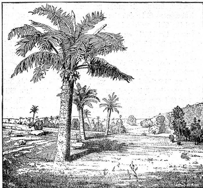
Landschaft der Jurazeit mit Sagobäumen, das Jagd- und Weidegebiet der Schreckensechsen.