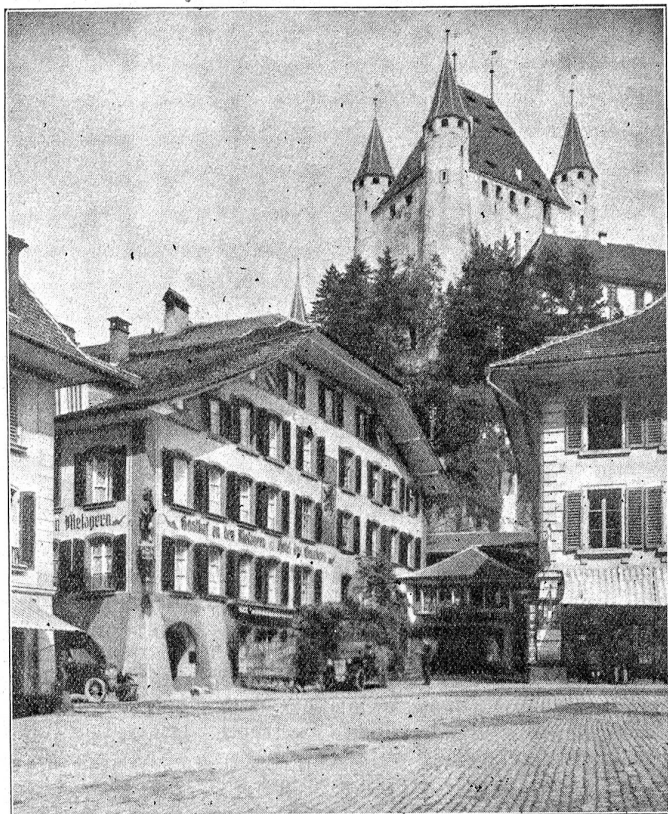
Das ehemalige Zunfthaus zu Metzger in Thun.

dreas Tag zu entrichtenden Zins von einem Maß Wein; sie verpflichten sich auch, gedachte Hofstatt unter den Trempeln offen und unbeschlössen zu halten, und auf die Tremmel