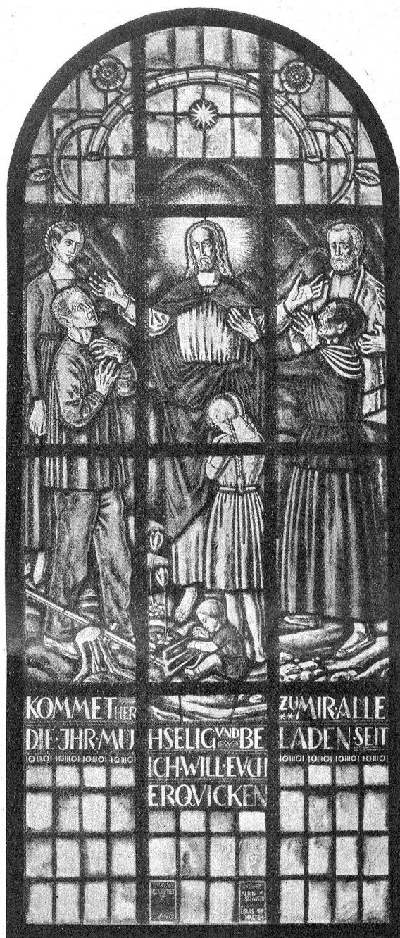
Chorfenster für die Kirche in Stettlen bei Bern.

Mit Hansjakob gab sich der Abt in der Folgezeit wenig mehr ab. Ein Gefühl der Beschämung hatte ihn beschlichen und bemeistert, seitdem er durch Magdalena in Hansjakobs Beisein eine so schimpfliche moralische Niederlage erlitten. Oft ließ er ihn sogar mit dem Grobkeller oder dem Prior allein speisen, nur um nicht durch des Meisters Gegenwart so schmerzlich erinnert zu werden an Dinge, die er nunmehr verwünschte, seitdem der Gegenstand seiner schwächlichen Begeisterung in die Ferne gerückt war. Dagegen kam er von Zeit zu Zeit in die Werkstätte und gab seiner Freude an den gelungenen Arbeiten des Meisters unverhohlen und oft in schmeichelndem Lob Ausdruck. Die herablassende Art und Weise, die einen Kern von wahrer Demut und hüßender Selbsterkenntnis barg, gewann ihm den Meister mehr als seine früheren, weniger aufrichtigen Kunstgriffe, und Hansjakob arbeitete mit mehr Lust und Eifer als je. Kaum daß er einmal das Kloster verließ, um einen Brief von Zürich im Dorfe Bettingen, wo jeden