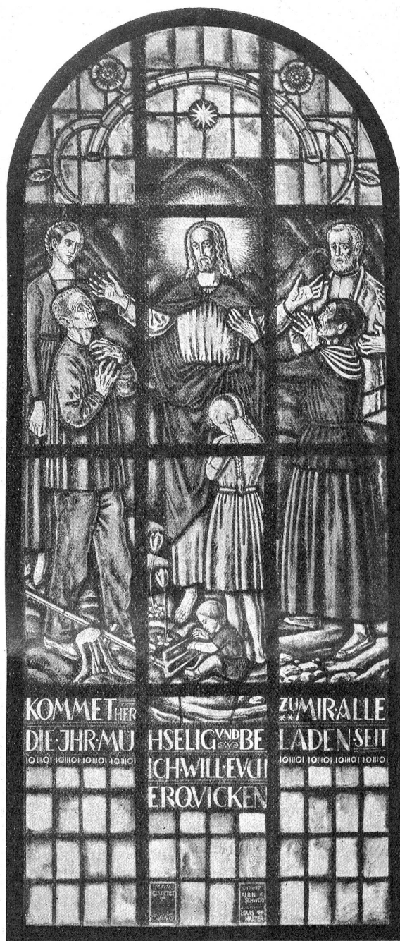
Chorfenster für die Kirche in Stettlen bei Bern.

Mit Hansjakob gab sich der Abt in der Folgezeit wenig mehr ab. Ein Gefühl der Beschämung hatte ihn beschlichen und bemeistert, seitdem er durch Magdalena in Hansjakobs Beisein eine so schimpfliche moralische Niederlage erlitten. Oft ließ er ihn sogar mit dem Grobkeller oder dem Prior allein speisen, nur um nicht durch des Meisters Gegenwart so schmerzlich erinnert zu werden an Dinge, die er nunmehr verwünschte, seitdem der Gegenstand seiner schwächlichen Begeisterung in die Ferne gerückt war. Dagegen kam er von Zeit zu Zeit in die Werkstätte und gab seiner Freude an den gelungenen Arbeiten des Meisters unverhohlen und oft in schmeichelndem Lob Ausdruck. Die herablassende Art und Weise, die einen Kern von wahrer Demut und hüfender Selbsterkenntnis barg, gewann ihm den Meister mehr als seine früheren, weniger aufrichtigen Kunstgriffe, und Hansjakob arbeitete mit mehr Lust und Eifer als je. Kaum daß er einmal das Kloster verließ, um einen Brief von Zürich im Dorfe Bettingen, wo jeden