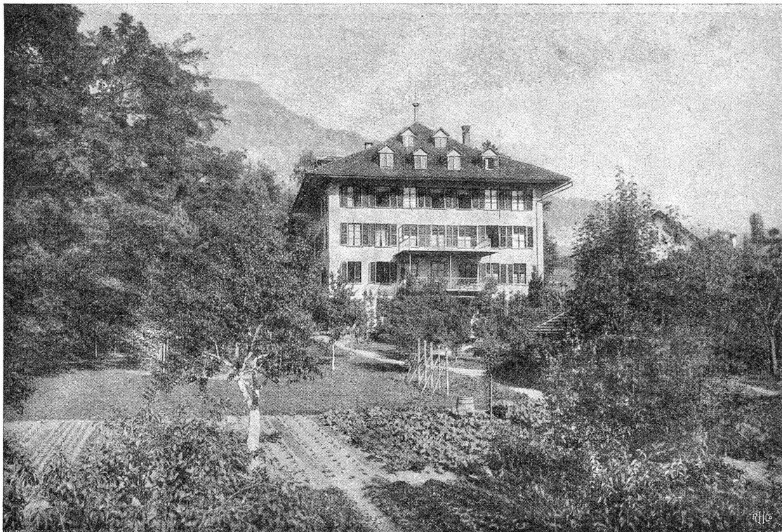
Die kantonale Alpwirtschafts- und Haushaltungsschule in Brienz. Das Schulgebäude mit Garten (Ansicht von Süden).

„Ihr gebt mir sonderbare Namen, Abt; doch bin ich anderen Berufs.“