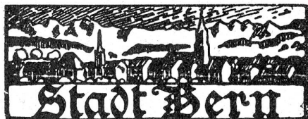
† Helene von Mülinen.

In der Detailberatung gab zu reden: die durch Spruchpraxis des Bundesgerichtes bedingte Erhöhung der steuerfreien Domizilfrist von 30 auf 90 Tage, die Steuerfreiheit für Korporationen, die sich mit Altersfürsorge befassen usw. Bei der Festlegung der steuerfreien Abzüge blieb unbestritten die Heraufsetzung des Existenzminimums von Fr. 1000 auf Fr. 1500 und die Zulassung eines Hausabzuges von Fr. 300. Für Kinder bis zu 18 Jahren können in Zukunft Fr. 200 abgezogen werden. —