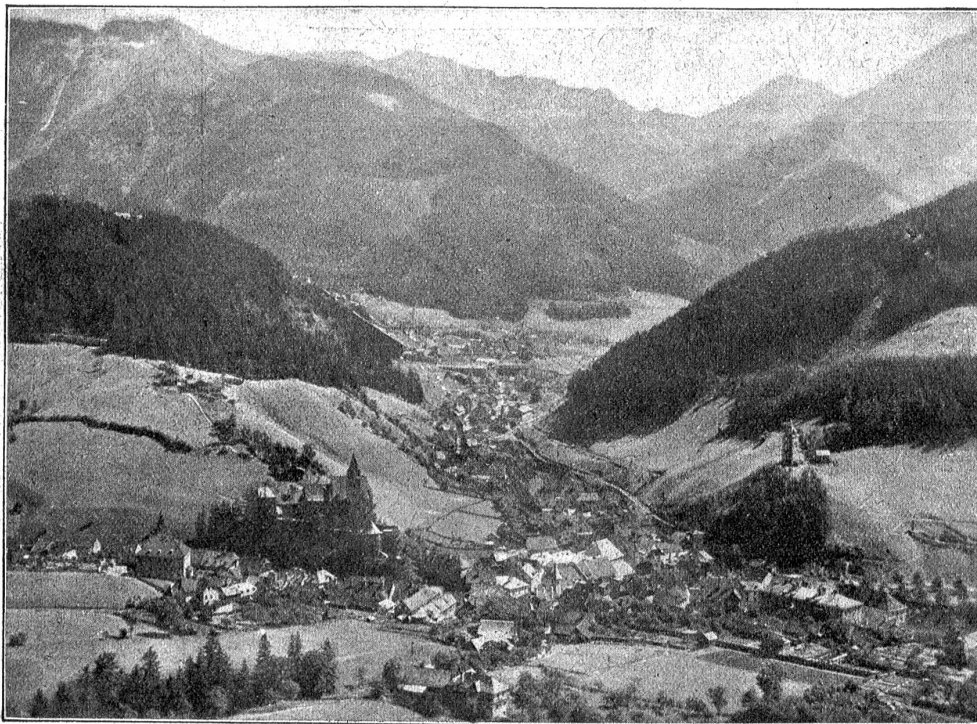
Eisenerz. Marktflecken von 7000 Einwohnern am Fuße des Erzberges in Obersteiermark, mit blühender Eisenindustrie.