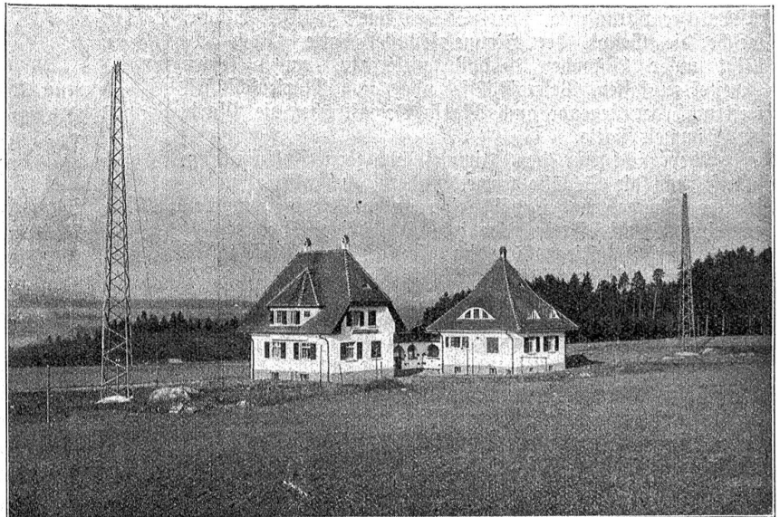
Aussenansicht der Empfangsstation Riedern bei Bern.

halbe Million Worte vermittelt hat. Der ursprünglich nur mit England aufgenommene direkte Verkehr erstreckt sich heute auch auf Spanien, Polen, Tschechoslowakei und Rußland. Versuche mit Stationen in der Türkei und Rumänien ergaben gute Resultate, sodaß auch eine einwandfreie Verkehrsaufnahme mit diesen Ländern möglich ist. Für den drahtlosen Verkehr mit der Schweiz sind ferner in Aussicht genommen: Schweden, Norwegen und Dänemark.