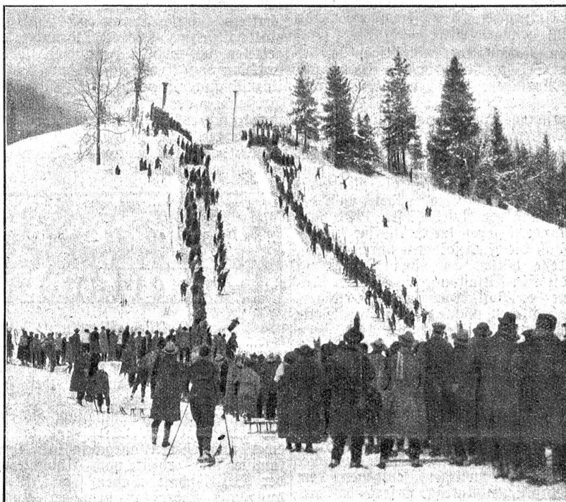
XVII. schweizerisches Skirennen in Grindelwald.

Die nationalrätliche Zolltarifkommission beschloß mit allen gegen drei Stim-