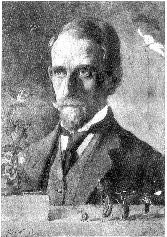
Ernst Kreidolf : Selbstbildnis.

Charlotte seufzte. „Ich weiß eben nicht, was ich wünschen soll. Wenn ich ein Mann wäre, so wüßte ich es. Ich würde in einer großen Stadt studieren, Geschichte oder Biologie oder Nationalökonomie, irgend eine Materie, die von einer Seite dem Menschen und der Menschheit beikommt; nebenbei ginge ich so viel als möglich aus, in die politischen Räte und Versammlungen, in die Armenquartiere und Zufluchthäuser, in Theater und Lokale, wo die Großstadts-gesellschaft hingehet — ich hätte reichlich ein paar Jahre zu tun, und nachher wüßte ich wahrscheinlich, wo ich mich hinstellen oder ob ich weiter lernen und sehen sollte. Vielleicht würde ich mir eine Familie gründen; vielleicht würde ich die Freiheit vorziehen, um einem Herzensberuf zu leben. Möglicherweise könnte ich diesen Plan auch als Mädchen ausführen, aber nur in sehr beschränkter Weise; und darüber eben hoffte ich, Sie befragen zu dürfen. Ich werde ja einen Bruch zu Hause riskieren müssen, und das ist