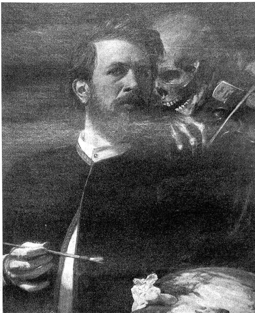
Arnold Böcklin, „Selbstbildnis mit Cod.“

Der Wanderer, Professor Faber, schaute über das liebliche Gelände hin, zog dann seine Uhr und schritt an der „Schönau“ vorbei dem Wiesenland zu. Aus den Matten strömte der feuchte Frühlingsgeruch der Erde, und Faber stand öfters still und atmete ihn begierig ein. Als er sich einer Bank näherte, die halb versteckt in einer Gruppe von knospenden Bäumen und Gebüsch stand, gewahrte er dort einen Menschen, der in einem Buche las. Er hatte den Arm lang über die Lehne der Bank gelegt und saß bequem hingestreckt wie einer, der recht mit Körper und