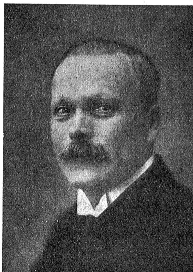
Ernst Chuard, der neue schweizerische Bundespräsident.

Lausanne und Würzburg Naturwissenschaften und wurde dann Professor der Chemie an der Universität Lausanne und zugleich Leiter der Station viticole. Im Jahre 1908 wurde er in den waadtländischen Großen Rat gewählt. Seit 1907 gehört er dem Nationalrat an. Im Jahre 1912 wurde er zum Staatsrat des Kantons Waadt ernannt und übernahm zuerst das Erziehungs- und Kulturdepartement, dann das Landwirtschaftsdepartement. Der neue Bundespräsident war seinerzeit auch Vizepräsi-