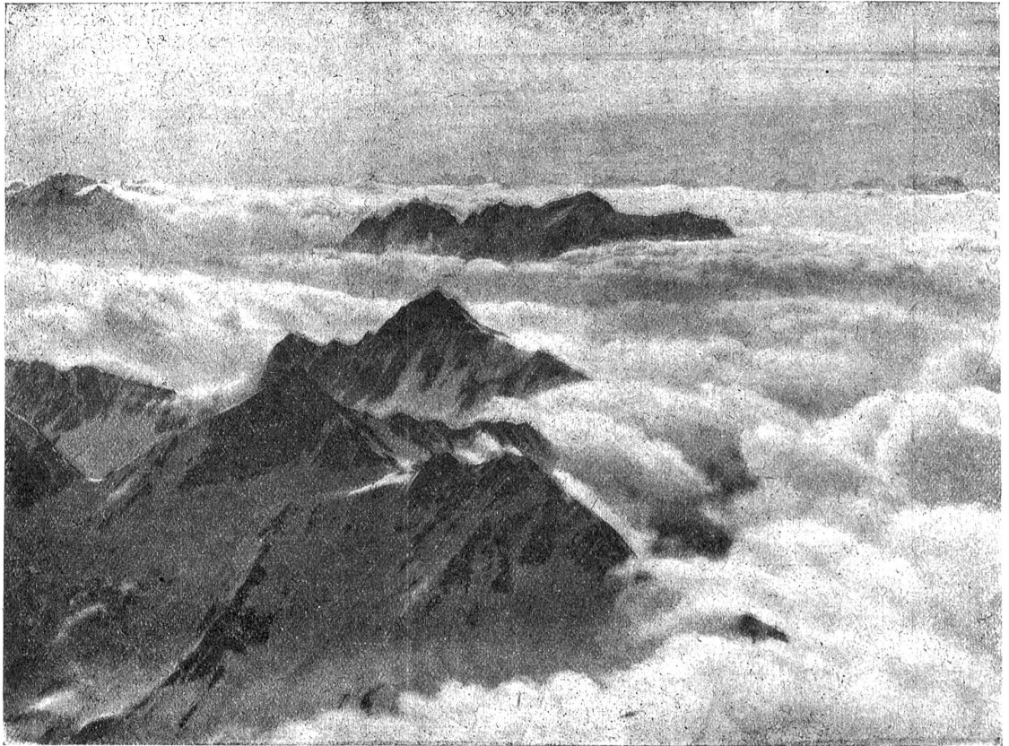
Nebelmeer über dem Lukmanier. Vordergrund: Piz Blas, Piz Rondadura. Mitte: Scopi; von W.