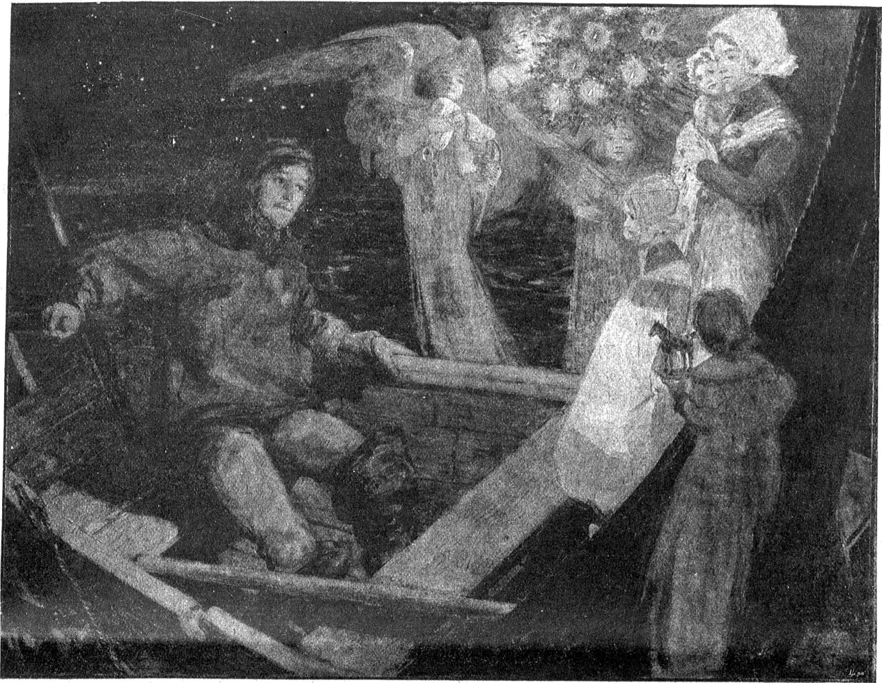
In der Christnacht. Nach der Originalzeichnung von R. Gepling.