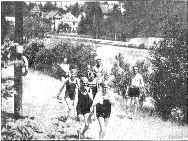
Auf dem Harestrandweg.