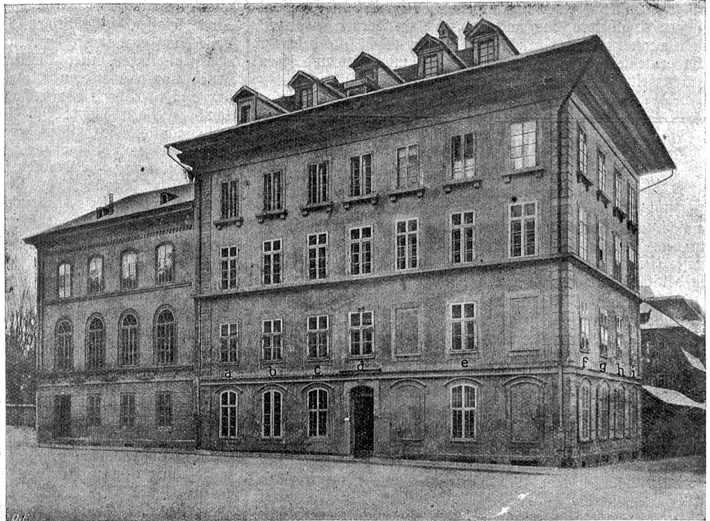
Die alte bernische Staatsapothekerei in Bern.