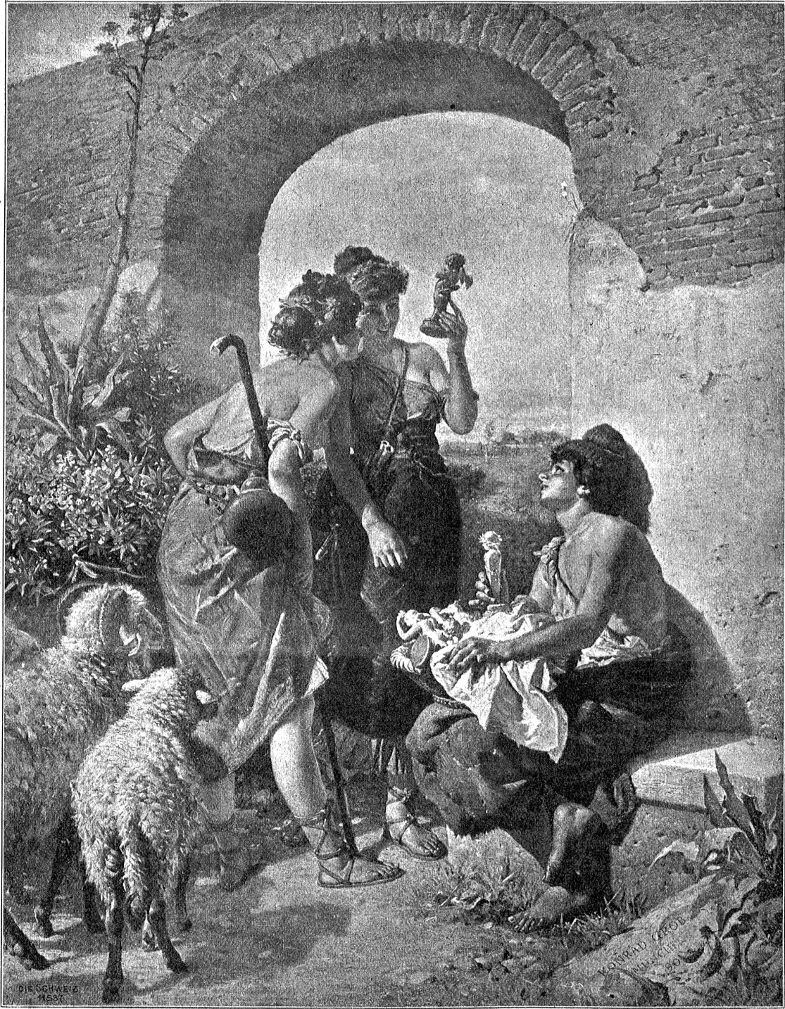
Die Hausgötterverkäuferin. Nach dem Gemälde von Konrad Grob.

Hand. Faber ließ sich nichts anmerken; aber das Zeichen, das ihm diese starke und gesunde väterliche Hand gab, hatte für ihn etwas Rührendes. Nicht umsonst wünschte ihm der alte Herr Befriedigung und Erfüllung seiner Wünsche. Im gleichen Alter hatte vor wenigen Jahren die Schwester den Tod gesucht; die Mutter der beiden war von Schwermut bedroht gewesen — alle Wünsche des alten Herrn gingen dahin, den Sohn glücklich zu sehen.