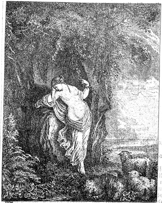
Salomon Gessner. Die trauernde Schäferin.

In der Tat, seine geschriebenen Idyllen sind kaum mehr eine Lektüre für unsere realistische, sagen wir es richtiger: materialistische Zeit. Wie könnten wir auch Interesse haben an diesen Hirten und Schäferinnen, die in einem weltfremden Arkadien träumen und ihre süßlich-pikanten kleinen Liebesgeschichten erleben! Die zumeist der klassischen Literatur entlehnten Motive sind zudem heute ausgeschöpft und tot.