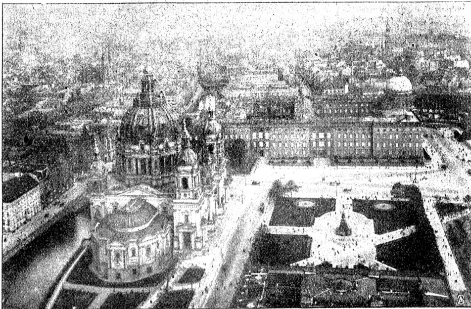
Dom, Schloss und Lustgarten.

daß nun bald große Kontinente zwischen ihnen lagen. Näher und näher trat die Drohung der Trennung durch unendliche Meere, die nicht mehr zu überbrücken waren.