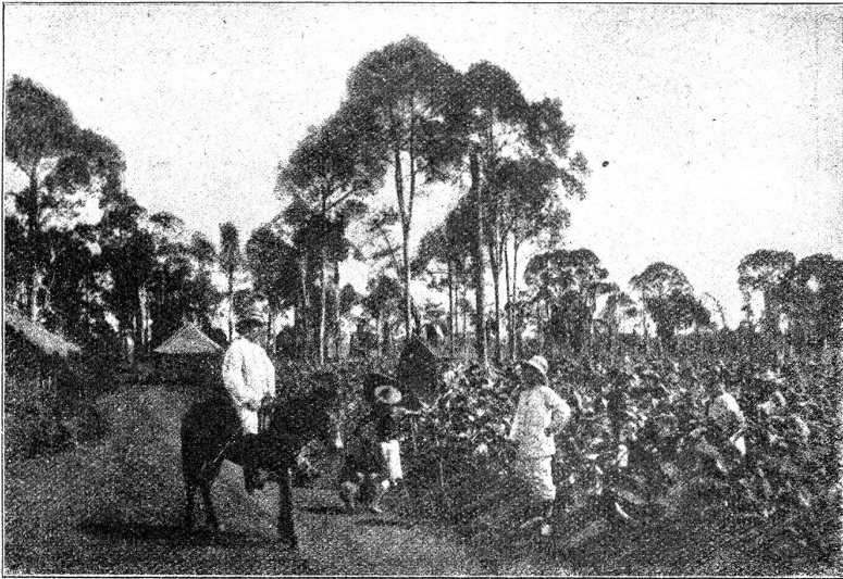
Schneiden des reifen Tabakes (Cualangs).

und um Verzeihung bitten konnte! Als ob ich selber auch nur gewußt hätte, warum ich diese unseligen Feigen stahl! Hatte ich das denn gewollt, hatte ich es denn mit Ueberlegung und Wissen und aus Gründen getan?! Tat es mir denn nicht leid? Litt ich denn nicht mehr darunter als er?