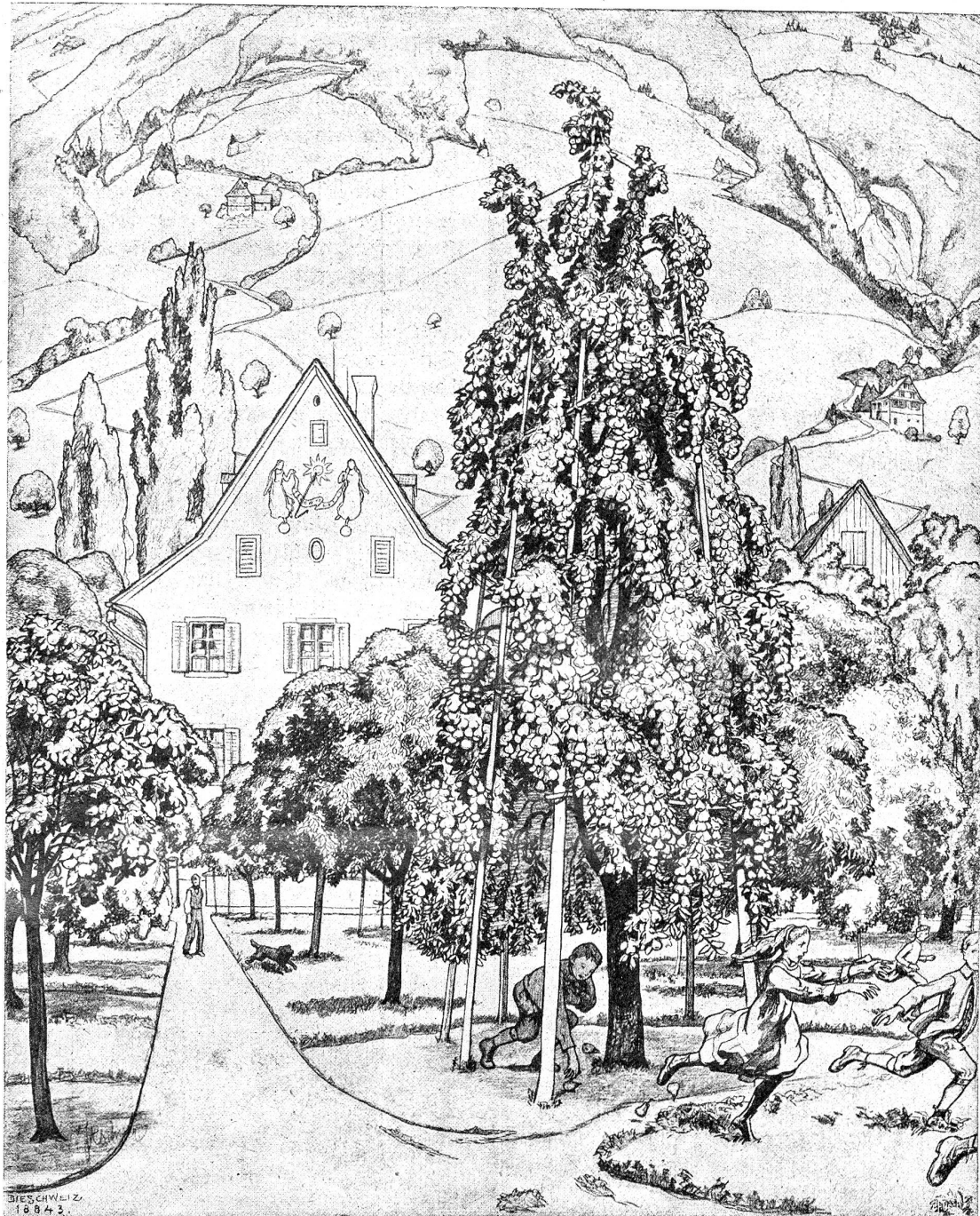
Karl Itzner : Herbstlicher Obstgarten.

Frau Barbara ging der Name, den Florentin gerufen, oder der Klang dieses Namens ins Innere wie ein Stich. Das war nie gewesen. War nun der Gedanke von vorhin schuld daran, daß die Nachbarstochter nun erwachsen sei, oder der andere, daß sie so seltsam klettenhaft dablief, oder die plötzliche, blickähnliche Erwägung, daß Florentin am Ende gar nicht geschlafen habe, daß er nur nicht — mit ihr habe reden mögen?