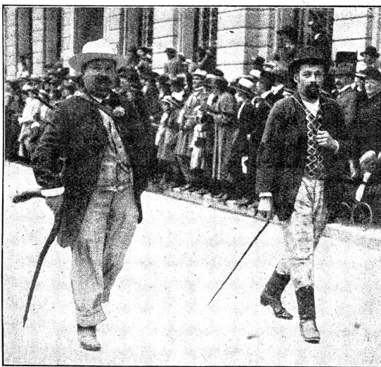
Aus dem Festzug der Gewerbeausstellung. Zwei einstige „dufte Kunde“ (reisende Handwerksburschen).

und eine elektrische Maschine zeigten das Einst und Jetzt der Wursterei. — Die Bäcker machten sich mit ihren