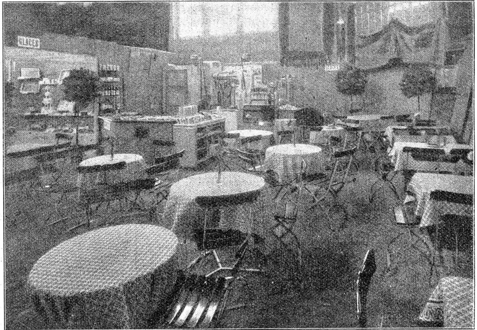
Gewerbeausstellung Bern 1922. Das Konditorei-Kaffee in der Reitschulhalle.

Tag für Tag, an Stod und Krüde Stelzt sie mutig über die Brücke, Trägt ihre Not auf nur einem Bein Weiter in den Alltag hinein. Näht sie dann eifrig bei ihren Kunden, Tauschte sie nicht mit einem Gefunden, So glücklich sitzt sie bei Nadel und Zwirn. Wohl fürcht' das Dasein ihr manchmal die Stirn, Sieht sie die Menschen eiligen Fußes. Doch freut sie sich wieder ihres Grukes, Des lieben Wortes und all' der Stunden, Wo sie den stillen Erwerb gefunden. —