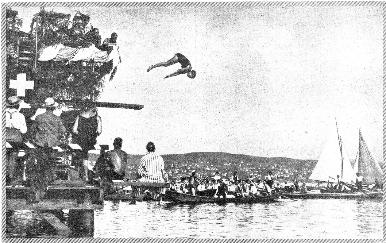
Von den schweizerischen Schwimm- und Wasserballmeisterschaften in Zürich.