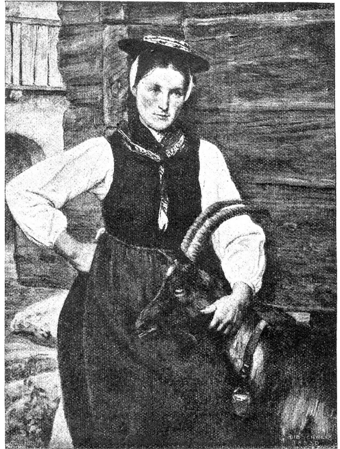
Henry van Nuyden : Mädchen mit Geiss.

„Liebe Mama,“ sagte sie leise und weich, „wenn ich sage: das liebe, alte Haus, ist denn das etwas anderes als du und der Vater selig? Wer hat die Rosen gepflanzt im Garten, die ich so gern habe? Du! Wenn ich sie liebe, liebe ich nicht dich? Wer hat das ganze Haus im Stande gehalten? Du! Wer hat den Kasten in den Gang gestellt? Du! Und wenn er mir so viel wert ist, bist du nicht in