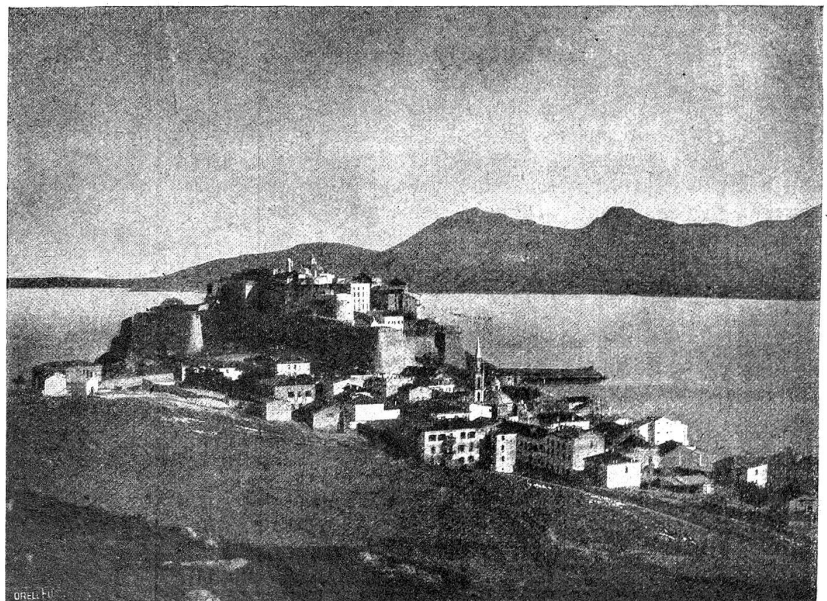
Wanderungen in Korsika. Calvi.

Wir dagegen gingen, die „Ebene“ verlassend, das herrliche Naturschauspiel der Calanche zu bewundern. Unter den Calanche versteht man ein fast zwei Kilometer langes Porphyrgebirgsmassiv, durch das sich die Straße windet. (Der Name erinnert an unser bündnerisches Felsental Calanca zwischen Biasca und dem Misox und enthält die Sprachwurzel für „Fels, Stein“). Der Porphyr ist stark rötlich-braun gefärbt und bildet, wie dies auch dem Granit eigen ist, merkwürdig launenhafte Zaden. Wie um Farbenkontrast und Reiz zu erhöhen, durchsetzen grüne Rasenflächen das Gestein, und ab und zu reckt sich eine dunkle Tanne empor. Raum hat man die vielgepriesenen Felsgebilde hinter sich, so entlockt dem Wanderer der Blick auf den malerischen Golf von Porto einen Ausruf des Entzückens. Die vom alten Weg herrührenden Abkürzungen benützend, steigen wir durch einen schönen Pinienwald zu ihm hinab.