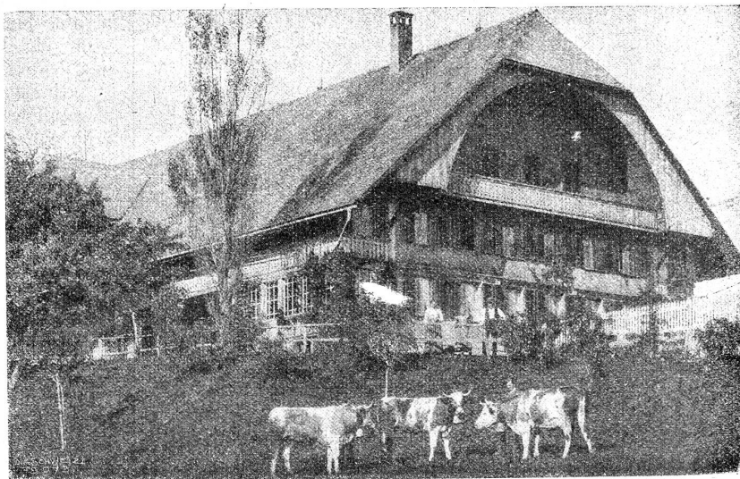
Der Ästig wott do. — Bauernhaus im Guggisberg.

Bekannt ist der alte Glauben, daß sich der Ruckuck im Winter in einen Raubvogel verwandle und als solcher sogar seine eigenen Pflegeeltern fresse. Schon Plinius hat diesen Glauben erwähnt und wir finden ihn weiter in einem