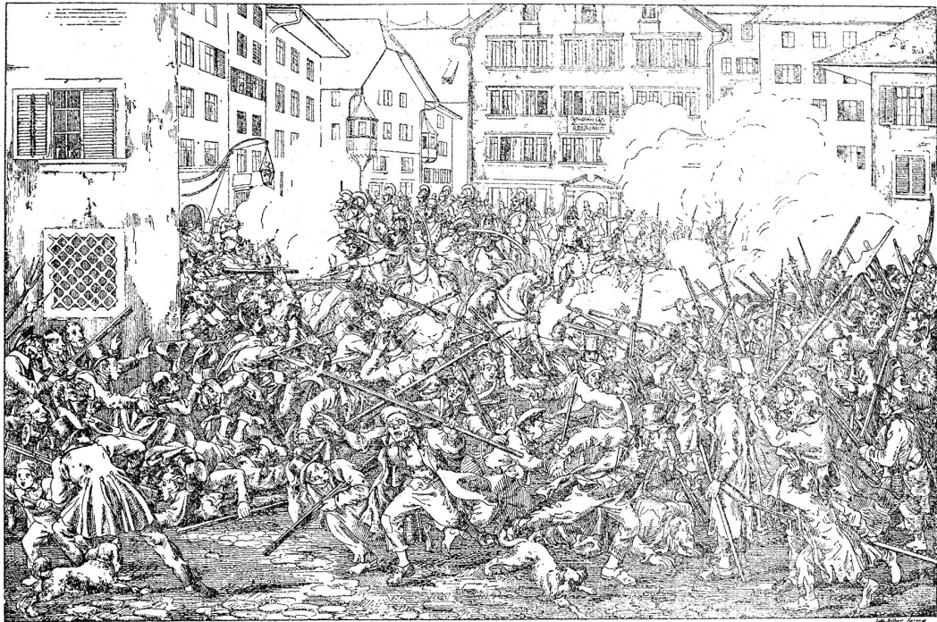
Der 6 te Herbstmonat 1839 in Zürich.

Disteli bald auch zur Darstellung zeitgenössischer Geschichte. Hier ist er ganz Parteimann; bald steht er auf Seiten der Bauern, wo diese ihre demokratischen Rechte erkämpfen gegen die aristokratisch gesinnten Städter (Basler Verfassungskämpfe) oder Mitbürger (Kampf der „Hörner“ und „Klauen“ im Kanton Schwyz), bald ergreift er Partei für die liberale Stadtregierung gegen die konservativen Bauern-Putschler (Züriputsch, Aargauer Klostersturm).