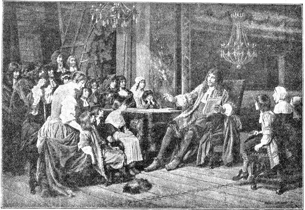
Molière und seine Truppe.

Die junge Frau Martha Singer hatte zum zweiten Male wieder geheiratet, und auf Wunsch ihres zweiten Mannes hatte sie ihre beiden Kinder fortgegeben. Der siebenjährige Ernst war in eine Erziehungsanstalt gekommen, wo er bis zu seiner Konfirmation bleiben sollte, der kleine dreijährige Gustav war zu seiner Großmutter — der Mutter der jungen Frau Dörte — gegeben worden, die in dem kleinen reizvollen Städtchen D.... S. wohnte. Frau Singer hatte sich sehr schwer von ihren Kindern getrennt, besonders von dem kleinen Gustav, der mit zärtlichster Liebe an ihr hing. Er war weich angelegt und mußte sehr unter der frühen Trennung von ihr leiden; — das wußte Martha,