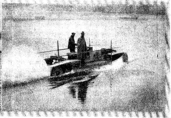
Das schwimmende Automobil von Vargoz.

Stadt Bern und in unserer aufgeklärten Zeit noch möglich sind, das berührt mein Gerechtigkeitsgefühl (oder wie man sich neuerdings ausdrückt, mein soziales Gewissen), und ich denke schon an Wohnungsrationierung und ähnliche Dinge. Doch die Frau erzählt weiter, ohne meine Gedanken zu merken. Und zwar kommt kein Klagen und kein Schimpfen, sondern eher ein Rühmen. Sie ist froh, daß sie gesund ist und jeden Tag verdienen kann für Mann und Kinder. Sie ist Abwaschfrau in einer Konditorei und kann jeden Abend ihren Kindern noch etwas zu essen heimbringen. Mit Freuden zeigt sie mir das Kesselfchen, in dem sie die Speisen heimträgt. Und über ihre Dachkammer schimpft sie nicht und neidet nicht der andern schöne Wohnungen. Denn in diese Kammer scheint Tag für Tag die Sonne, und darüber ist sie froh und glücklich. Mehr als einmal muß sie mir sagen, wie schön die Sonne hineinscheint. Nachdem sich die Türe hinter der reichen armen Frau geschlossen hat, muß ich ein Weilchen den Kopf in die Hand stützen, in mich hineinschauen und mich fragen: Hat nicht die Frau in ihrem Innern die wahre Sonne, die man allen Menschen wünschen möchte. Und ich fühle in mir den Wunsch, diese Sonne auch zu besitzen.