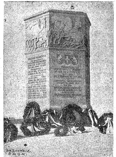
Das bernische Kavallerie-Denkmal auf der „Queg“ bei Affoltern im Emmental.

Wir haben an dieser Stelle schon der Soldatendenkmäler in Oberdießbach, Wangen und Spiez in Wort und Bild Erwähnung getan. Seither sind zwei neue monumentale Stätten entstanden, die des frühen Todes junger hoffnungsvoller Söhne des Landes im verhängnisvollen Grippenjahr 1918 gedenken. Auf der „Queg“, der aussichtsreichen Warte des Unteremmentaler Hügelsgebietes, steht das bernische Kavallerie-Denkmal und in Langenthal in einer freien Anlage das Denkmal für die toten Wehrmänner Langenthals und Umgebung. Das erstere ist ein sechseckiger prismatischer Quaderbau mit reichem Reliefschmuck; das Bauwerk schaut still und ernst ins Bernerland hinaus. Anderer Art, architektonisch-feierlich, gedacht für die freien horizontalen Perspektiven eines Gartens, ist das andere. Bei beiden haben tüchtige Künstler ihr Bestes gegeben. Sie sind wertvoll als Maßstäbe für die künftig zu gewärtigenden Werke dieser Art.