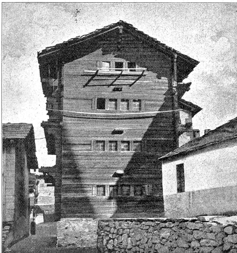
Walliser Haus, mehrstöckig. (Evolena, Wallis.)

Geschlecht auf Geschlecht vorübergeht, Das Hugelgespenstchen sie übersteht, Vertroänet — wer sie sieht, der hebt — Zu einem Urträunchen, aber lebt. In einer Lade, mit Glas darauf, Stellt man sie endlich im Dome auf; Am Totensonntag nur regt's drin Und seufzt, kaum hört man's vor sich hin...“