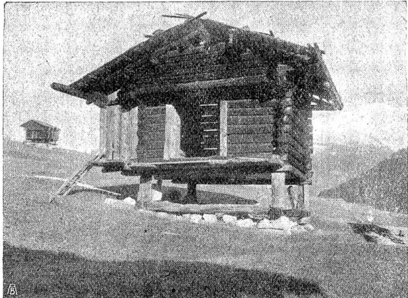
Kornspeicher auf Stelzen. (Graubünden und Wallis.)

ähnelt der tessischen Bauart und weist wie diese die Vorlaube vor, hier „la Krupa“ oder „Sotó“ geheißen. Daneben finden sich Häuser mit burgundischem Einschlag. Kenn-