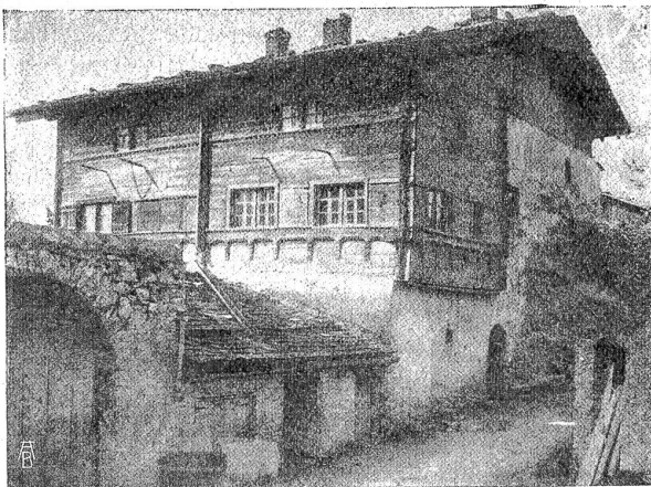
Alpenhaus aus Holz und Stein. (Malans, Graubünden.)

Da sieh, der Wachmeister rennt mit drei starken Kerlen durch den Regen. Sie packen Schwarz, den Narren, sie schleppen ihn unter Dach. Er brüllt: „Fahret ihr zum