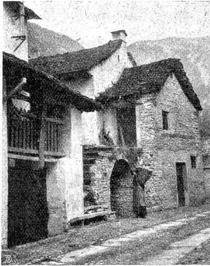
Cossiner Steinhaus mit Steinplattendach. (Cegna bei Locarno.)

Freudiger tritt aus dem Hause Angelos. Die Menge schweigt. Er steigt langsam die Dorfstreppe von Tre Pinci