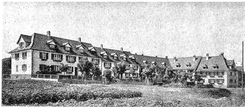
Wohnkolonie der Fabrik Maggi, Kempttal.

Frauenbewegung in der Schweiz sich als Ziel ihrer Arbeit denken. Ihre Rede bewies, daß sie die Idee der Frauenbefreiung reiflich erwogen und durchdacht hat. Sie kennt aber auch die Hemmungen und die Schranken der Bewegung und weiß, daß sie als Hüterin der ihr immanenten religiösen Grundidee hinweisen muß auf das „Eine was not tut“ und daß sie warnen muß vor falschen Wegen.