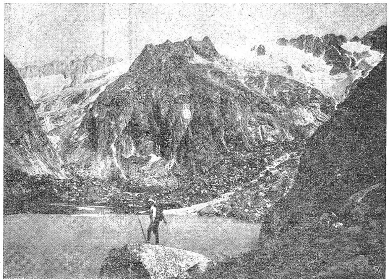
Der Gelmersee oberhalb Guttannen. Soll durch einen 50 Meter hohen Damm gestaut werden.

In kluger Anlehnung daran, was hier das Hochgebirge vorgezeichnet, doch mit kühner Ueberwindung seiner Hindernisse, ist folgendes vorgesehen: Durch einen Stausee von 55,600,000 m 3 Nutzinhalt wird bei der Grimsel die Wassermenge gefaßt, welche aus dem Sammelgebiet der beiden Naregletscher strömt. Ein Leitungstollen führt sodann im Innern des rechten Talhangs mit wenig Gefälle hinaus zum Gelmersee, der sich nicht allzuschwer in einen zweiten