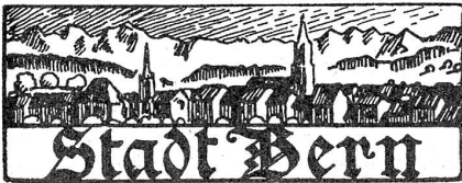
† Wilhelm Roos,

Das Personal der Berner Oberland-Bahnen und mitbetriebenen Linien hat die Intervention des Regierungsrates im Lohnkonflikt mit der Verwaltung dieser Bahnen abgelehnt und ist am Donnerstag früh in den Streik getreten.