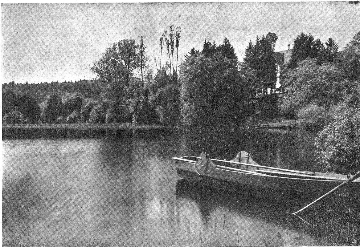
Am Katzensee. Bucht beim Herrschaftshaus.

Da steht eine häßliche Ziegelfabrik; Telegraphenstangen „zieren“ das nackte Ufer; wüster Schutt ist in den See hinausgeschmissen worden; vom nahen Dorf hat man ihn wagenweise hergeführt. Es ist eine Schande und ein Spött! So hat man dieses Landschaftskleinod „gefaßt“. Auf der einen Seite mit Eigennutz und Engherzigkeit, auf der andern mit Dummheit und Gleichgültigkeit! — Wir sprechen hier nicht von einem bestimmten Fall, aber doch von Wahrem und Erlebtem. Und weil Verhöhnung und Verschönerung von Seelandschaften, wie wir sie eben beschrieben, möglich sind, so freut es uns umso mehr, unsern Lesern ein Gegenbeispiel vorführen zu können: ein Schweizerseelein, wo „der Mensch mit seiner Qual“ — d. h. mit seiner Gewinn-