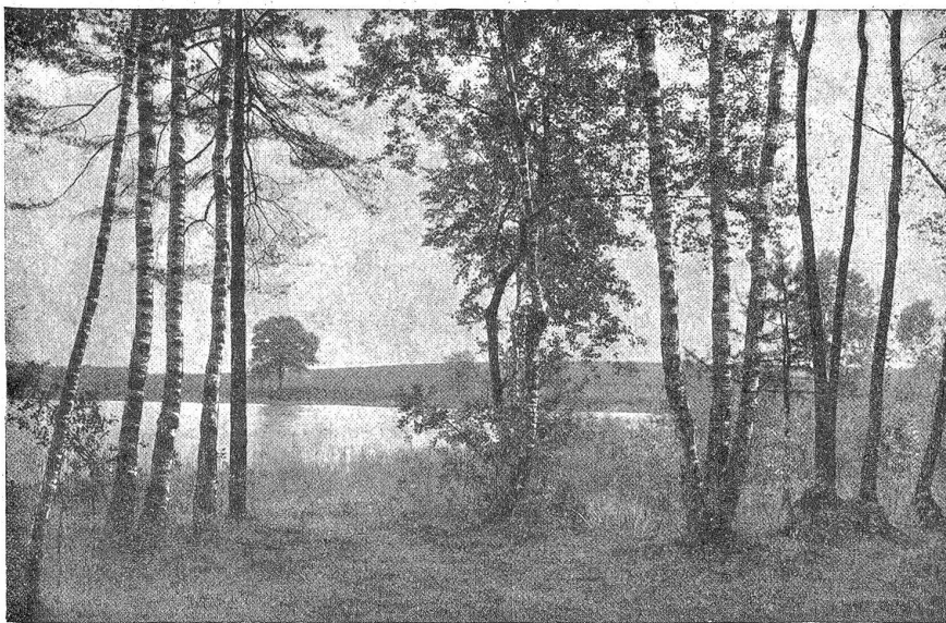
Am Katzensee. Blick aus dem Birkenwäldchen auf den kleinen See.

lichkeiten und Herrlichkeiten dieser Seelein von der einen Längsseite her auf mehreren Wegen und Weglein der Öffentlichkeit zugänglich sind. Hier kann der strahlen- und häusermüde Städter sonntags sein Auge und seine Seele vollsaugen an einem schönen Landschaftsbild: An dem blauen Seebecken, in dem sich des Himmels Wolken spiegeln, an den sanftgeschwungenen Hügel-linien darüber, den malerischen Baumgruppen, den fruchtbaren Wiesen und Aedern der Landschaft. Er kann dem Lied der Wellen lauschen und kann, wenn er ein Poet ist, von Nixen und Elfen träumen. Der Botaniker findet seltene Pflanzen, den Bärlapp und das Sonnentau, der Vogelfenner Sing- und Wasservogel aller Art, die anderswo nicht mehr zu sehen sind: Störche, Fischreiher, Birk- und Schneehühner. Herr Wed, der Besitzer der Seelein und des einen Ufergeländes, ist ein verständnisvoller und zielbewußter Mehrer und Er-