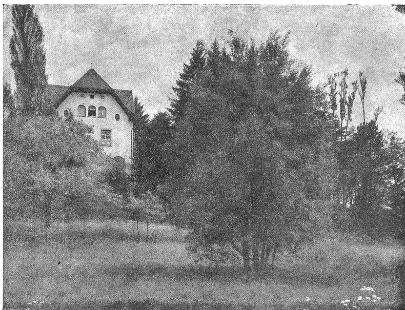
Am Katsensee. Das Herrschaftshaus. (Aufnahme von Joh. Meiner, Zürich.)

wir an. Auf dem Fußweg, den wir betreten haben, um diesen Genüssen entgegenzueilen, glökt uns eine Verbotstafel an — „Bei einer Buße von 10—50 Franken — Richterlich bewilligt.“ Was soll das sein? Privatbesitz! Verflucht! Die schönsten Dinge werden uns da von irgend einem „Privatier“ vor der Nase weggeschnappt! Die Naturschönheit gepachtet, abgehagt und eingezäunt! Sind wir in einer Monarchie oder Demokratie? Gehört das schöne Vaterland Einzelnen oder der Allgemeinheit? — Doch was hilft das Schimpfen! Da sind nun einmal die Heimatschützer noch nicht oder zu spät hingekommen. Auf der andern Seite ist der See zugänglich. Sehen wir mal dorthin! O weh!