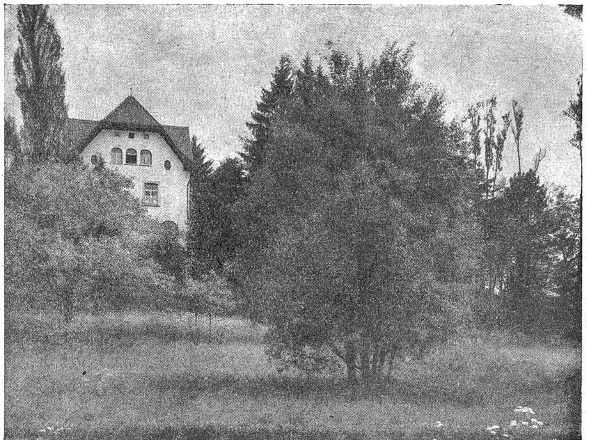
Am Katzenssee. Das Herrschaftshaus. (Aufnahme von Joh. Meiner, Zürich.)

wir an. Auf dem Fußweg, den wir betreten haben, um diesen Genüssen entgegenzueilen, glözt uns eine Verbotstafel an — „Bei einer Buße von 10—50 Franken — Richterlich bewilligt.“ Was soll das sein? Privatbesitz! Verflucht! Die schönsten Dinge werden uns da von irgend einem „Privatier“ vor der Nase weggeschnappt! Die Naturschönheit gepachtet, abgehagt und eingezäunt! Sind wir in einer Monarchie oder Demokratie? Gehört das schöne Vaterland Einzelnen oder der Allgemeinheit? — Doch was hilft das Schimpfen! Da sind nun einmal die Heimatschützer noch nicht oder zu spät hingekommen. Auf der andern Seite ist der See zugänglich. Sehen wir mal dorthin! O weh!