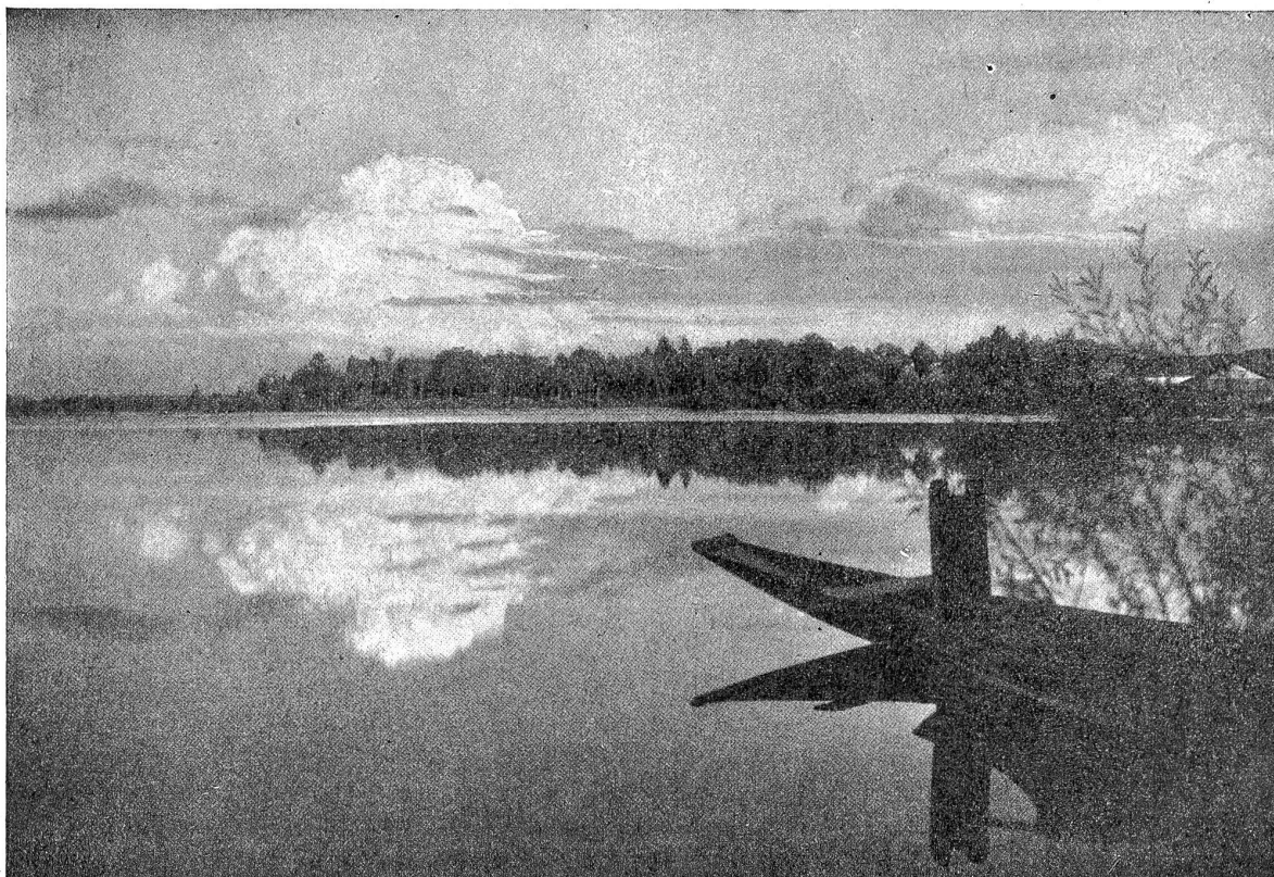
Am Katzenssee (Kt. Zürich). Rechtes Ufer des größeren Sees. Von links nach rechts: Birkenwäldchen, Badeplatz, Staatswaldung, Eisschuppen. (Aufnahme von Joh. Weiner, Zürich.)

Eltern war Licht, ich sah's am Schlüsselloch, und drin hörte ich ein schmerzliches Wimmern. Wie ich zum Haus und zum Dorf hinauskam und auf welcher Straße ich in die Fremde lief, weiß ich nicht. Meine Gedanken fingen erst wieder zu schaffen an, als mir die Sonne in die Augen blitzte und ich auf einem Kreuzweg das Wandern nach meinem Schatten begann.“