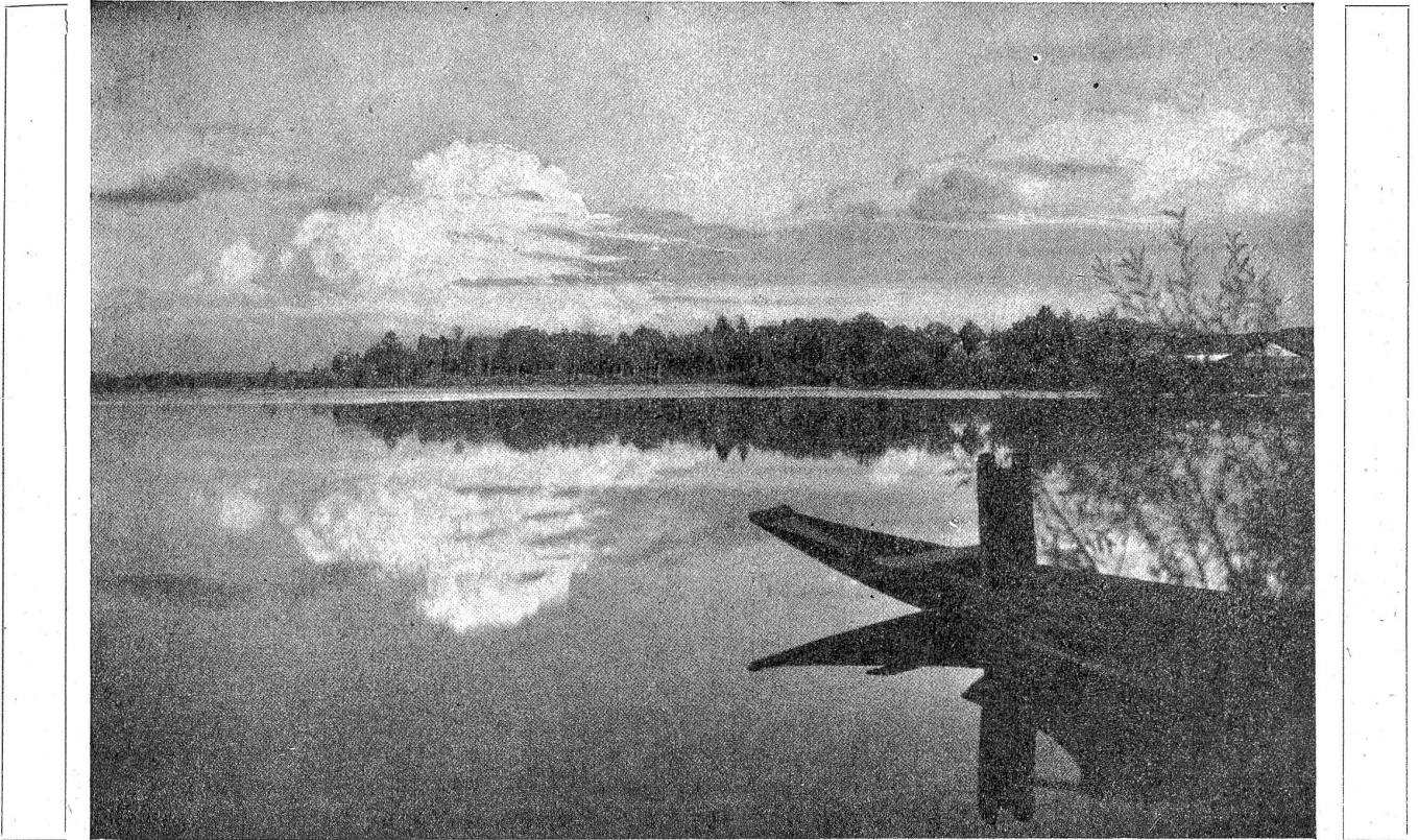
Am Katzenssee (Kt. Zürich). Rechtes Ufer des größeren Sees. Von links nach rechts: Birkenwäldchen, Badeplatz, Staatswaldung, Eisschuppen.

Eltern war Licht, ich sah's am Schlüsselloch, und drin hörte ich ein schmerzliches Wimmern. Wie ich zum Haus und zum Dorf hinauskam und auf welcher Straße ich in die Fremde lief, weiß ich nicht. Meine Gedanken fingen erst wieder zu schaffen an, als mir die Sonne in die Augen blitzte und ich auf einem Kreuzweg das Wandern nach meinem Schatten begann."