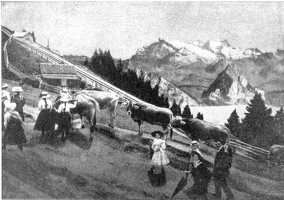
Zum fünfzigjährigen Jubiläum der Vignau-Rigibahn: Zwischen Staffel und Kulm.

In jenen Tagen lief ein herrenloser Hund in unser Dorf, es war ein rotes, abgemagertes Tier, unheimlich! Er schnupperte an einer Türschwelle nach der anderen und lief dann mit eingezogenem Schwanz weiter. Die Buben warfen hinter den Gartenzäunen mit Steinen nach ihm, die Frauen bedrohten ihn mit den Besenstielen, der alte Hebammenmann spuckte aus seinem Fensterflügelchen weit auf die Straße hinaus und rief seinem Nachbar Speich zu: